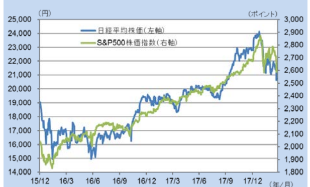
<日経平均株価、S&P500指数の推移>

るリスクオフの展開となれば、相対的に安全資産と言われる円が買われ、円高ドル安の長期化が企業収益の下振れ要因となり、株価を押し下げることになると予想されます。